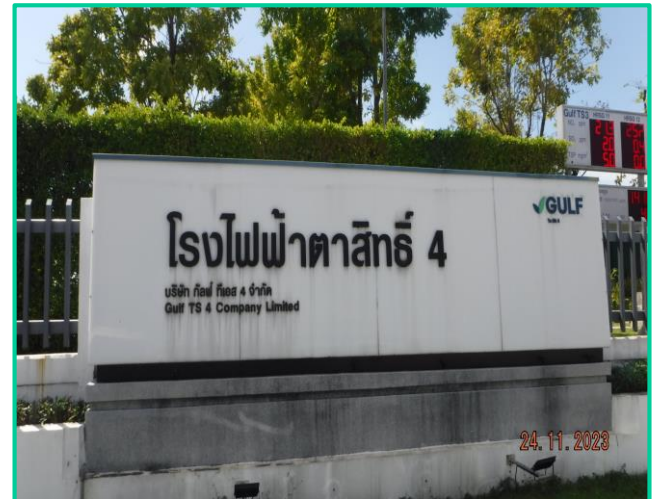
บริเวณด้านหน้าโรงงาน