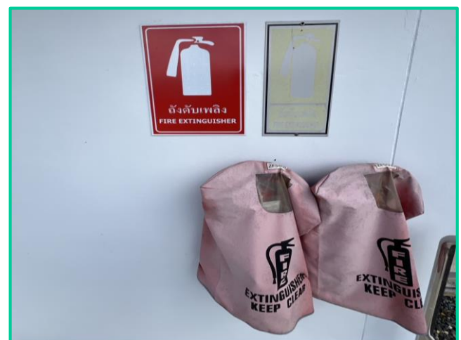
ถังดับเพลิงบริเวณท่อส่งก๊าซฯ

ภาพที่ 3.2-17 ภาพถ่ายระบบรักษาความปลอดภัยตามแนวท่อส่งก๊าซฯ และบริเวณสถานีก๊าซฯ ของโครงการท่อส่งก๊าซธรรมชาติไปยังโรงไฟฟ้าตาสีทรี 4 โรงไฟฟ้าตาสีทรี 3