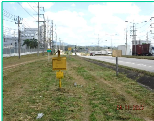
ป้ายเตือนแนวท่อส่งก๊าซฯ บริเวณโรงงาน