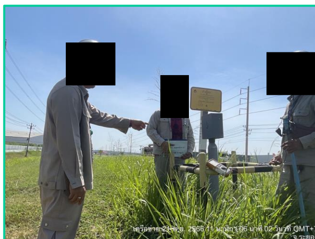
พนักงานสวมใส่ชุด PPE