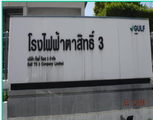
บริเวณด้านหน้าโรงงาน