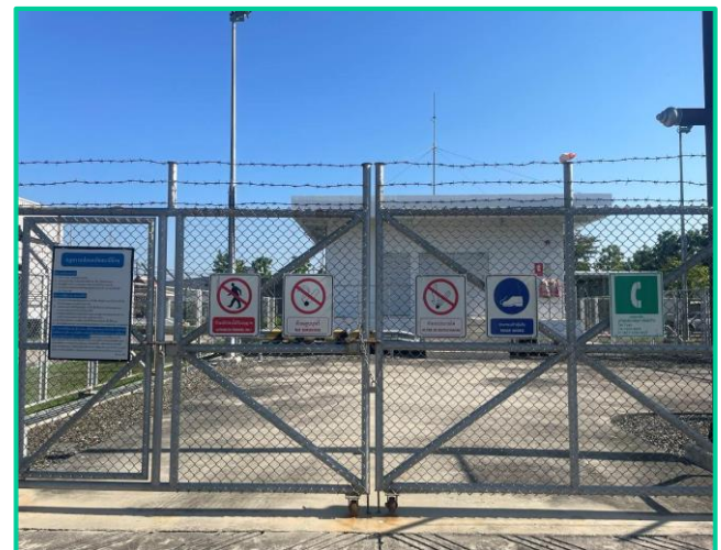
ป้ายเตือนต่าง ๆ บริเวณสถานีควบคุมความดันก๊าซ (MRS)